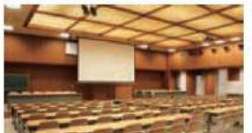
203 会議室 (108名)