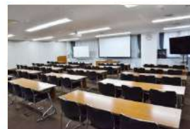
402 会議室 (60名)