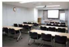
405 会議室 (21名)