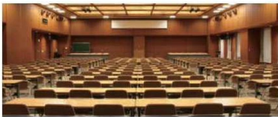
大会議室【203+204会議室】(270名)