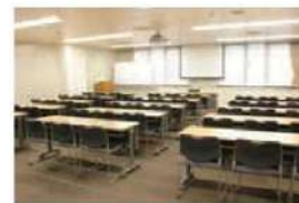
501 会議室(45名) ※土日祝のみ貸出し