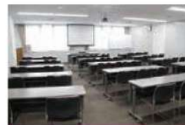
404 会議室 (40名)