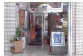
1階 レストラン 暫(しばらく)