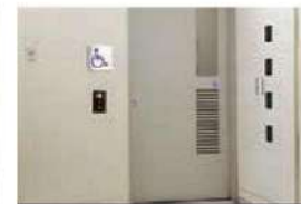
1階・2階 多目的トイレ