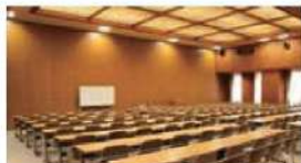
204 会議室 (144名)