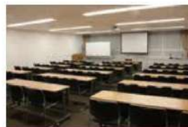
401 会議室 (54名)