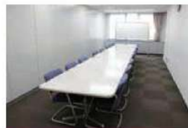
403 会議室 (16名)